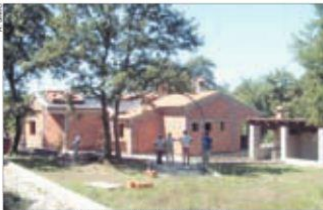
Pri kraju prva faza izgradnje "Kuće svjetla"

- Centar u Cukrićima treba postati profitabilan i steći međunarodno značenje te se povezati s ljudima iz drugih zemalja, prvo iz onih bližih.