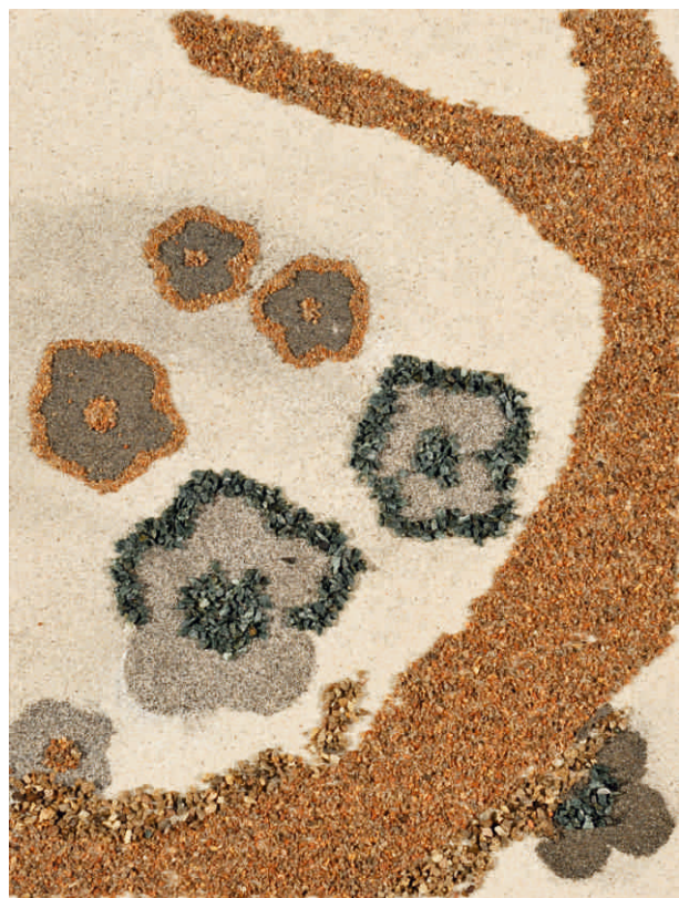
Fatime Nyikes, HU