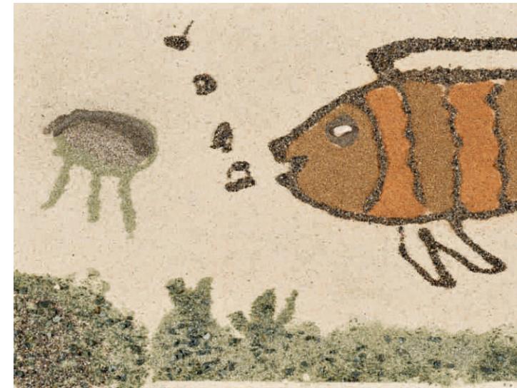
Elvis Vujič, SLO