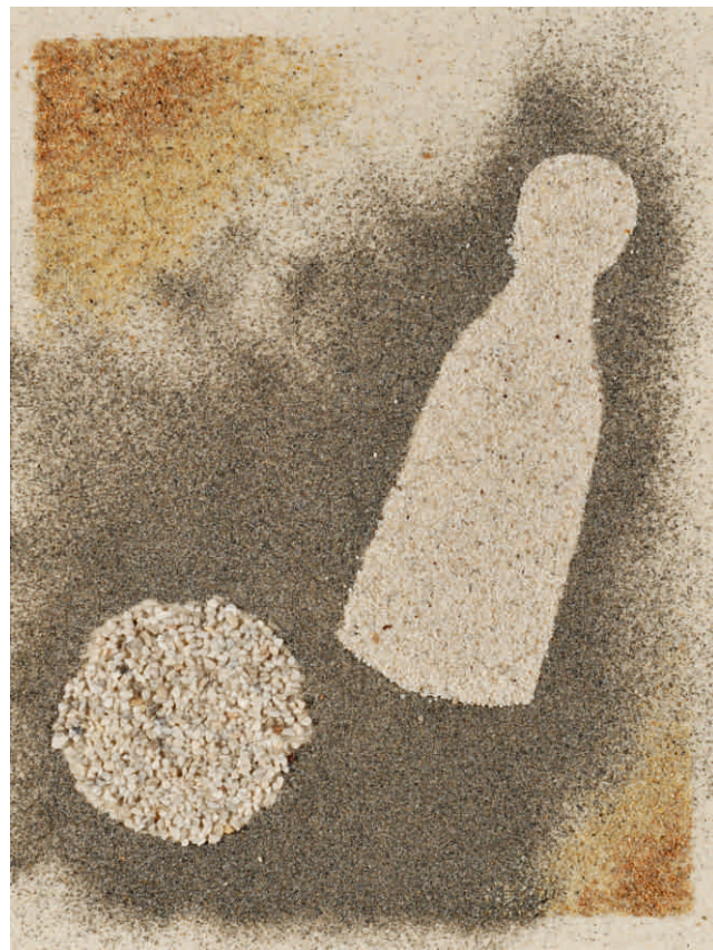
Tomaž Furlan, SLO