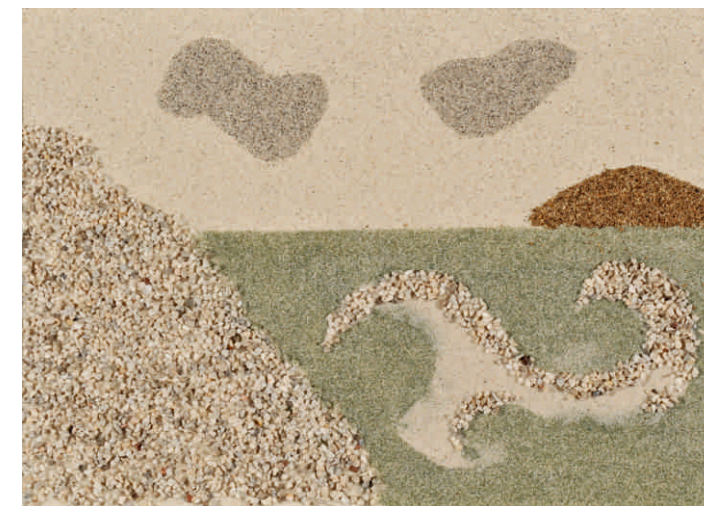
Danijela Stoković, HR