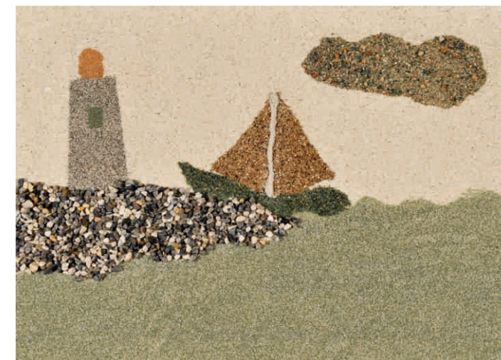
Gréti Angel, HU