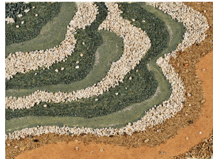
Izabelle Czagány, HU